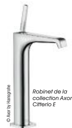
Robinet de la collection Axor Citterio E