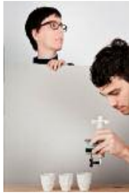
Henry van de Velde Awards - Unfold