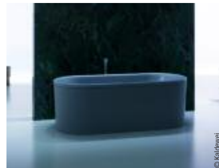
Meisterstück Centro Duo Oval