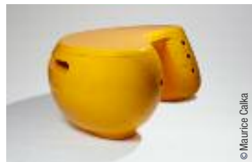
Orange Dreams - Bureau Boomerang

Le point de départ de cette exposition est la collection du Plasticarium, le musée du plastique dont Philippe Decelle est l'inspirateur