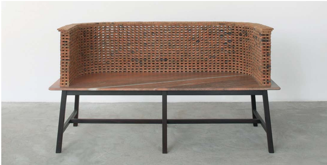
ci-contre Le BRICK STUDIES I & II par le Studio Mumbai / Bijoy Jain.